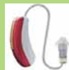
Ecouteur déporté dans le conduit Ce mini-contour transmet le son par un micro tube relié: